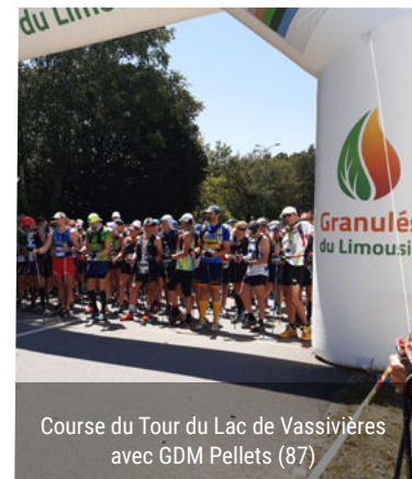
Course du Tour du Lac de Vassivière avec GDM Pellets (87)