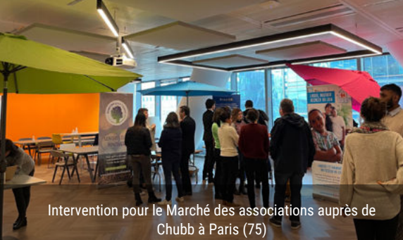
Intervention pour le Marché des associations auprès de Chubb à Paris (75)