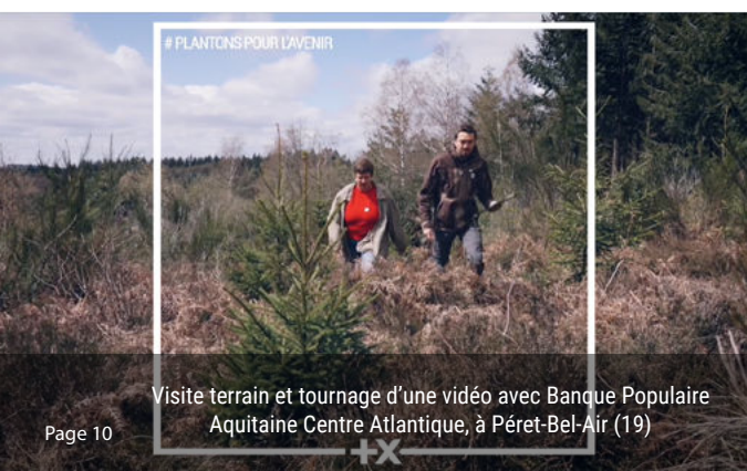
Visite terrain et tournage d'une vidéo avec Banque Populaire Aquitaine Centre Atlantique, à Péret-Bel-Air (19)