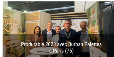
Producible 2023 avec Burban Palettes à Paris (75)