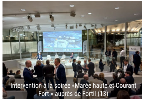
Intervention à la soirée « Marée haute et Courant Fort » auprès de Fortil (13)