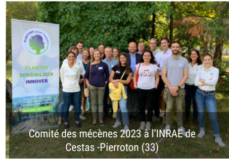
Comité des mécènes 2023 à l'INRAE de Cestas -Pierroton (33)