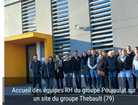
Accueil des équipes RH du groupe Poujoulat sur un site du groupe Thebault (79)