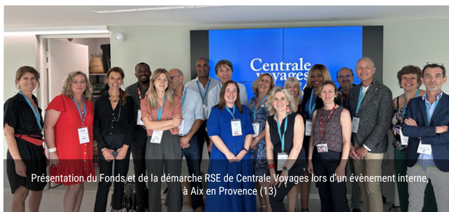
Présentation du Fonds et de la démarche RSE de Centrale Voyages lors d'un événement interne, à Aix en Provence (13)