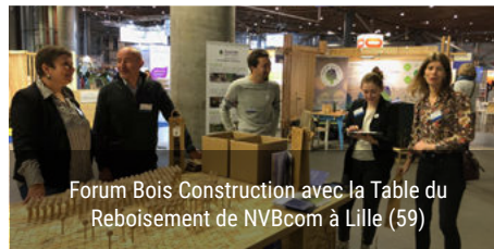
Forum Bois Construction avec la Table du Reboisement de NVBcom à Lille (59)