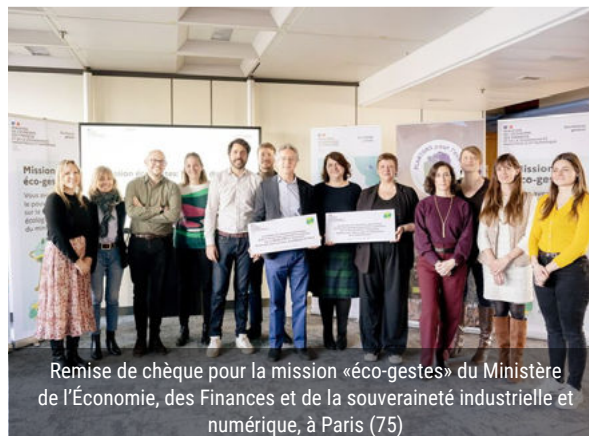
Remise de chèque pour la mission «éco-gestes» du Ministère de l'Économie, des Finances et de la souveraineté industrielle et numérique, à Paris (75)