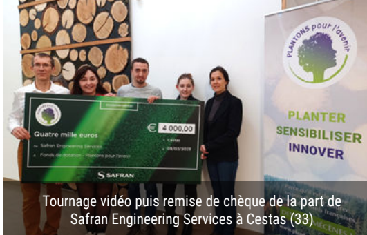
Tournage vidéo puis remise de chèque de la part de Safran Engineering Services à Cestas (33)