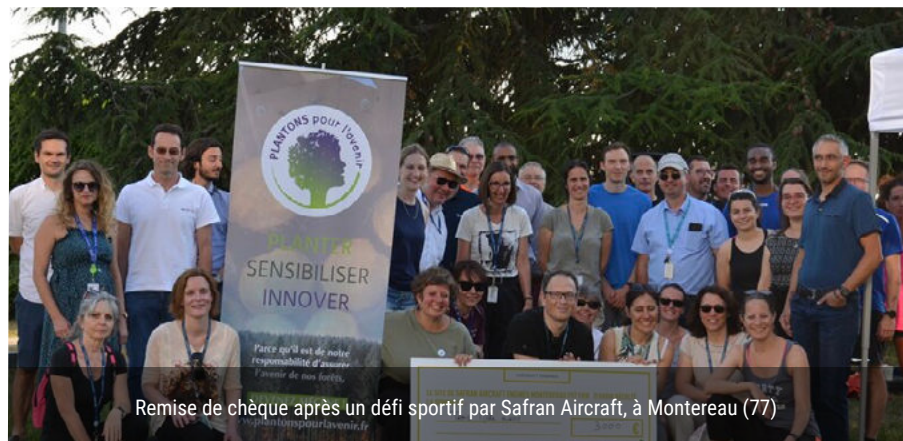
Remise de chèque après un défi sportif par Safran Aircraft, à Montereau (77)