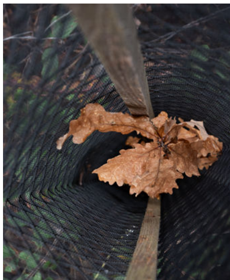
Plant de chêne protégé individuellement par filet