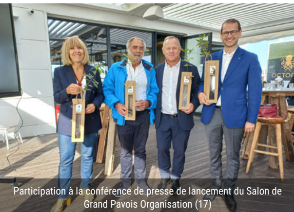
Participation à la conférence de presse de lancement du Salon de Grand Pavois Organisation (17)