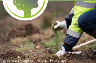
© France Douglas - Yoann Portejoie