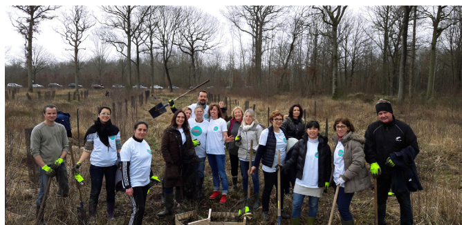
Plantation de Chêne rouvre avec Air France et le Cabinet Coudert, 23 & 30 janvier, Seine et Marne.