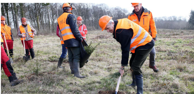
Plantation de Douglas, Epicéa de Sitka et Châtaignier avec Herta, Dalkia et NSF2A, 21 mars, Pas de Calais.