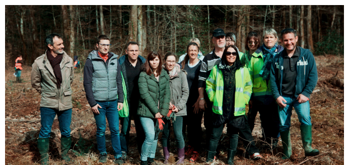
Plantation de Douglas avec Ikea Industry et F&BE, 11 avril, Haute-Saône.